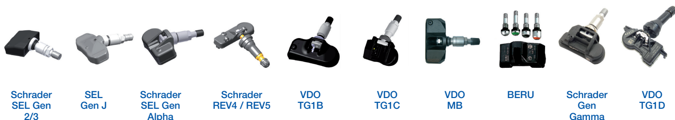
Schrader SEL Gen 2/3