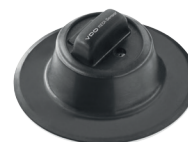
C6000 / C6001 / C6002